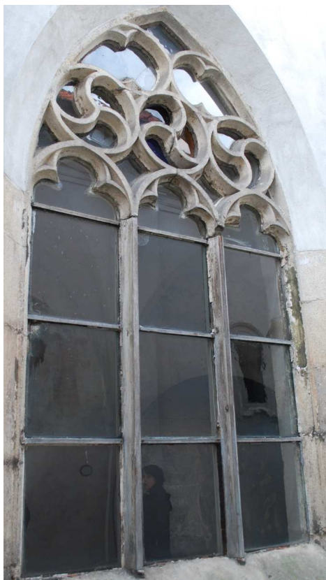
Pohled z rajského dvora 110210 hl 065

Poškozené, nevhodná náhrada kamenných prutů dřevěnými, poškozené zasklení.