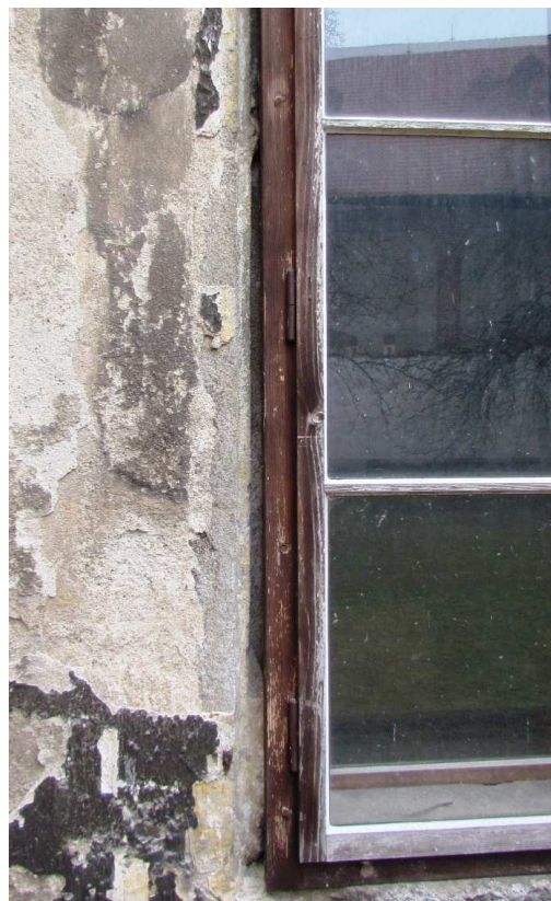
Detail stojky 110310 hl 077