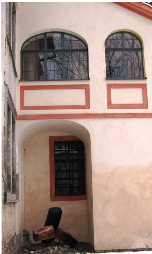
Pohled z nádvoří 1101 TS 120