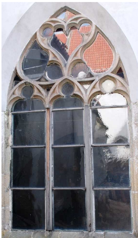
Pohled z rajskeho dvora 110210 hl 059

Poškozené, nevhodná náhrada kamenných prutů dřevěnými, poškozené zasklení.