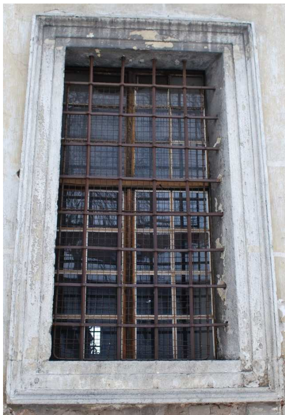
Pohled z nádvoří – OS/15.1 110127 hl 329