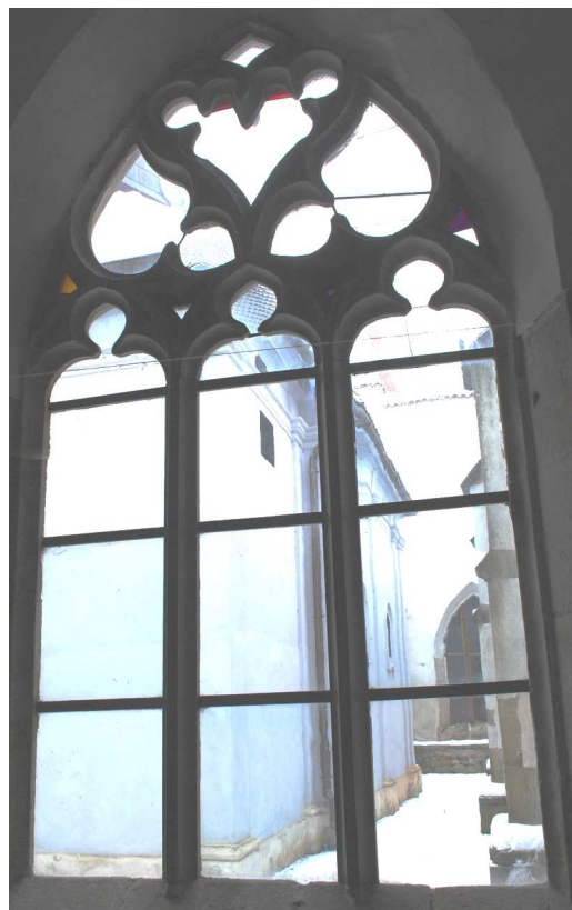
Pohled z ambitu 110127 hl 241