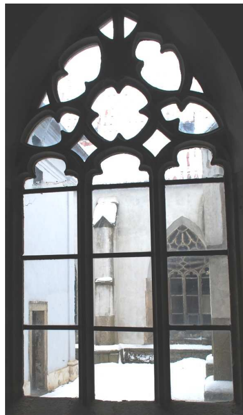
Pohled z ambitu 110127 hl 243