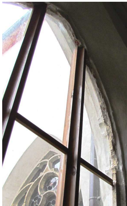
Pohled z ambitu, detail 110310 hl 028