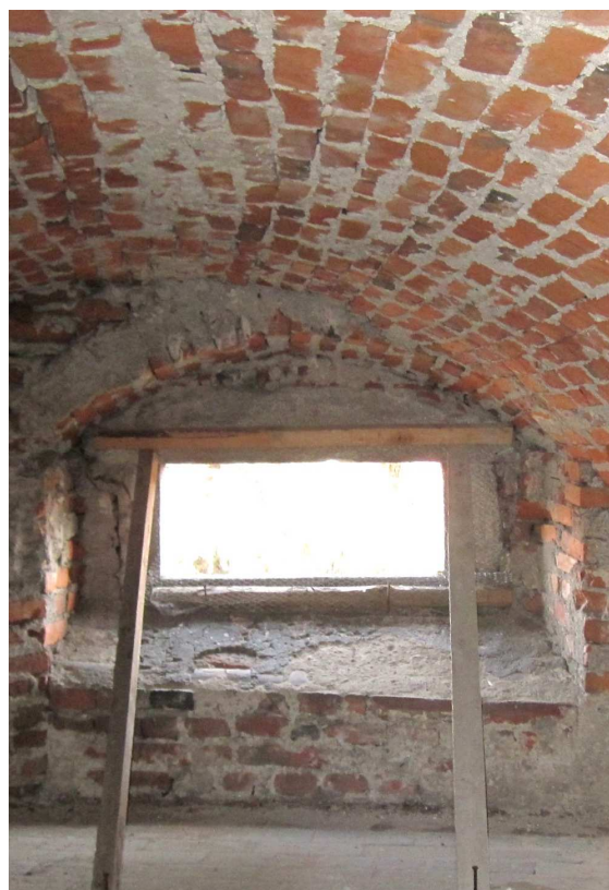
Pohled z podkroví 110210 hl 104