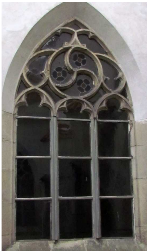
Pohled z rajskeho dvora 110310 hl 034

Poškozené, nevhodná náhrada kamenných prutů dřevěnými, poškozené zasklení.