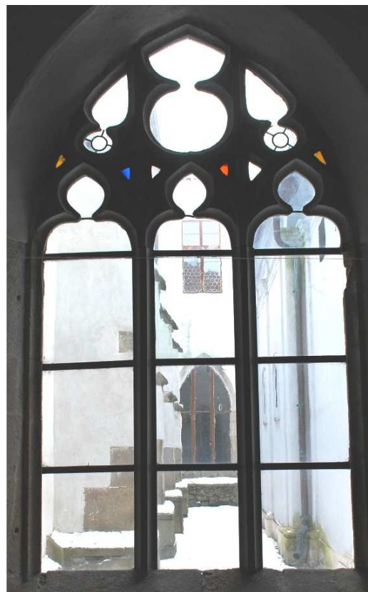
Pohled z ambitu 110127 hl 242