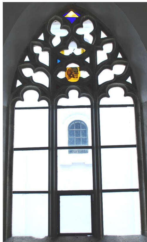
Pohled z ambitu 110127 hl 237