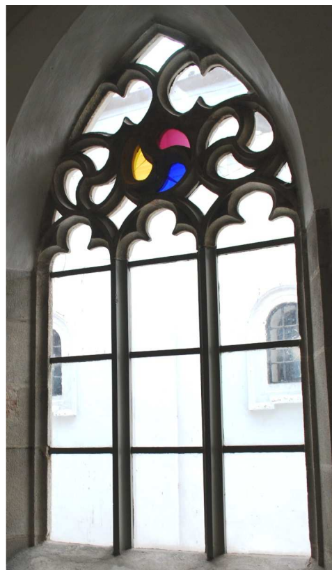
Pohled z ambitu 110127 hl 245