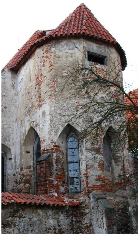
Presbyterium 110210 hl 193