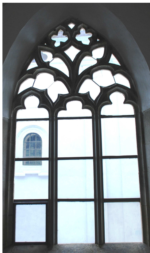
Pohled z ambitu 110127 hl 236