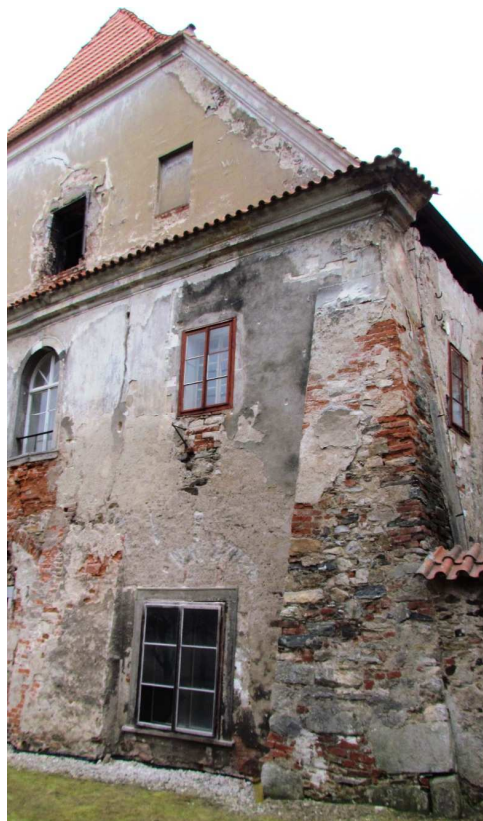
Pohled na východní štít konventu 110310 hl 079