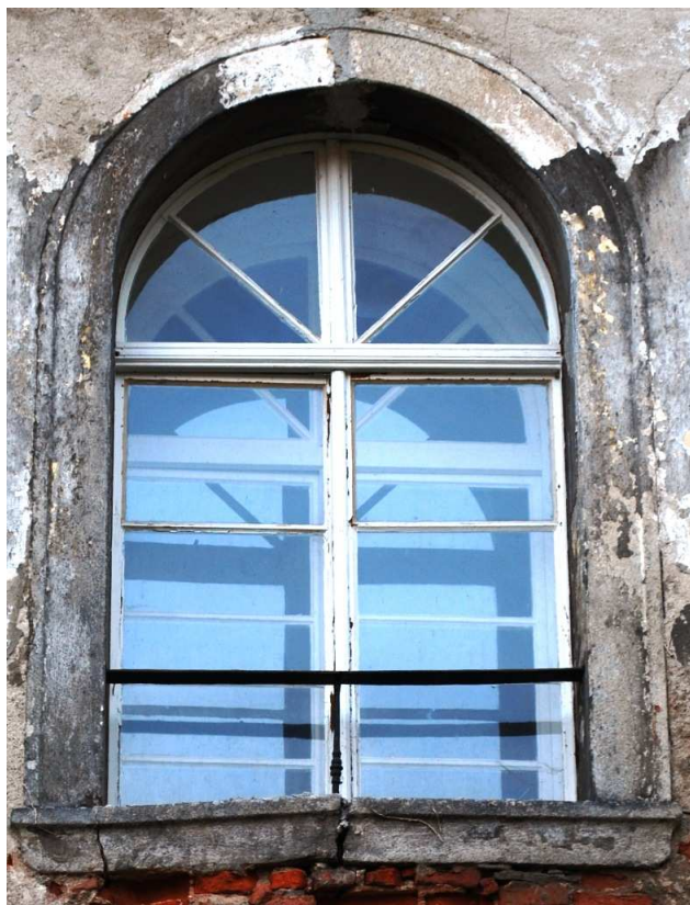
Celkový pohled 110210 hl 188