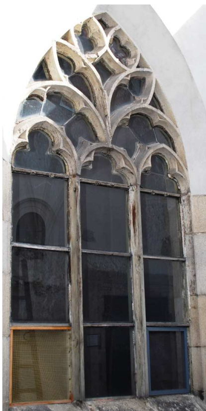
Pohled z rajského dvora 110210 hl 055

Poškozené, nevhodná náhrada kamenných prutů dřevěnými, poškozené zasklení.