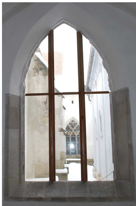
Pohled z ambitu 110127 hl 234