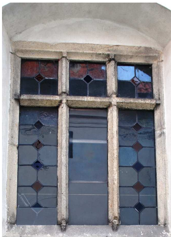
Pohled z rajského dvora 110210 hl 061

Místy poškozené, ve střední části chybí vitráž.