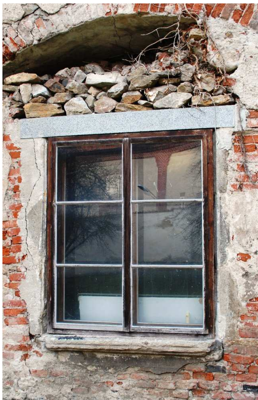
Celkový pohled 110210 hl 191

Značně poškozené, nevhodný novodobý překlad.