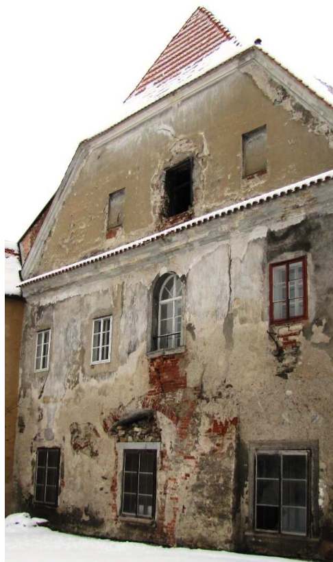
Pohled na východní štít konventu 1101 TS 031