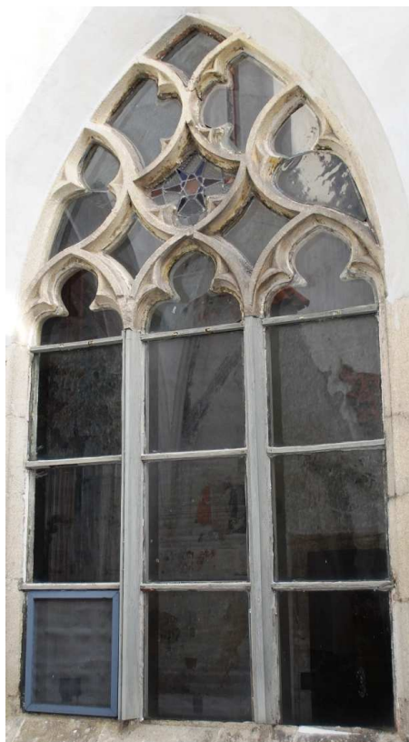
Pohled z rajskeho dvora 110210 hl 054

Poškozené, nevhodná náhrada kamenných prutů dřevěnými, poškozené zasklení.