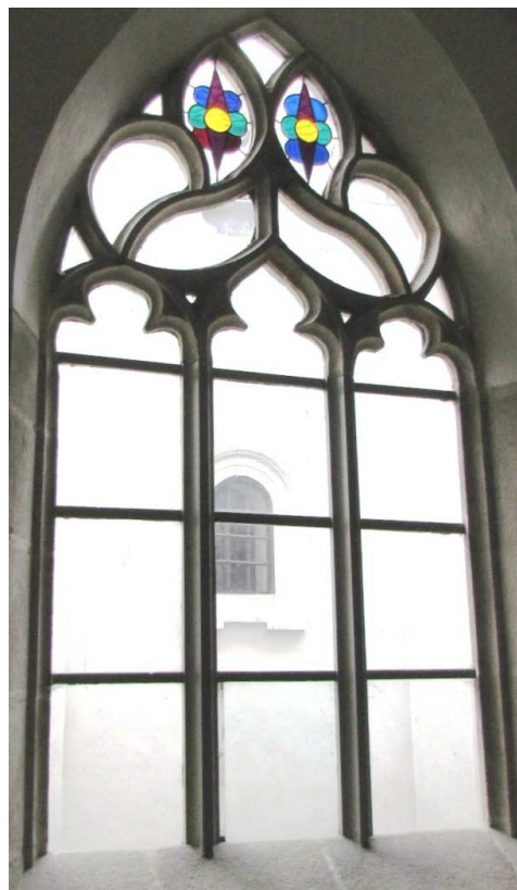
Pohled z ambitu 110310 hl 031