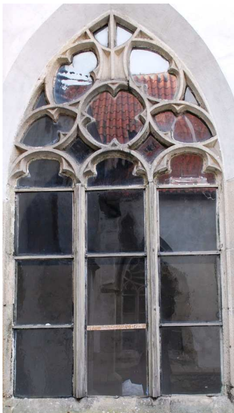
Pohled z rajskeho dvora 110210 hl 063

Poškozené, nevhodná náhrada kamenných prutů dřevěnými, poškozené zasklení.