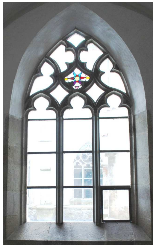
Pohled z ambitu 110127 hl 235