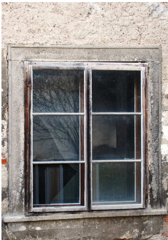
Celkový pohled 110210 hl 190