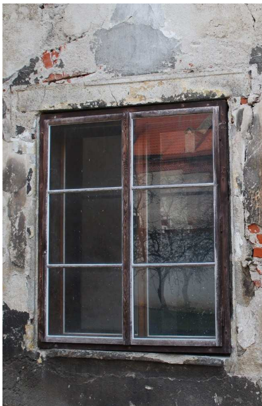
Celkový pohled 110210 hl 192