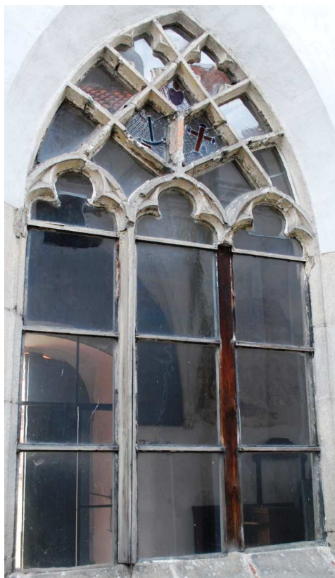
Pohled z rajskeho dvora 110210 hl 064