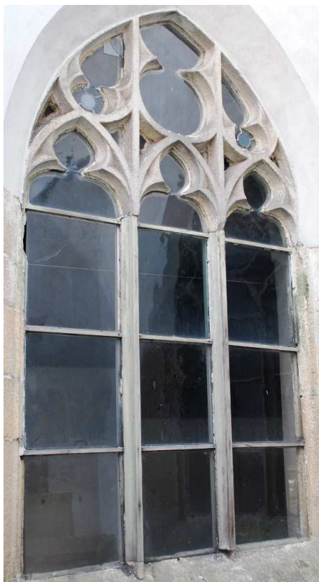
Pohled z rajskeho dvora 110210 hl 062