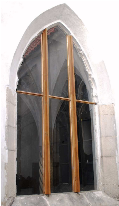
Pohled z rajskeho dvora 110210 hl 053