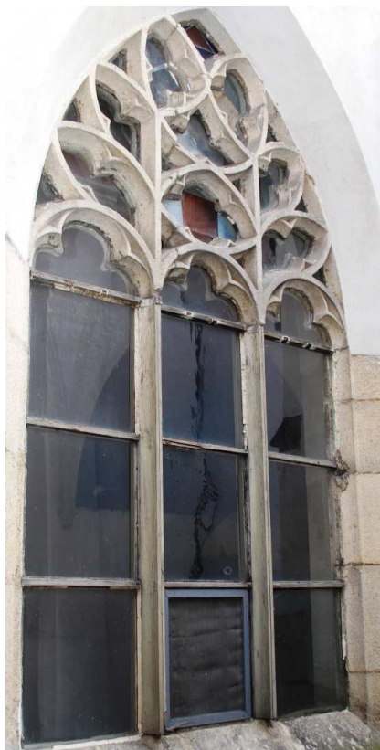
Pohled z rajskeho dvora 110210 hl 056

Poškozené, nevhodná náhrada kamenných prutů dřevěnými, poškozené zasklení.