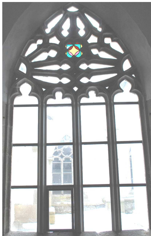
Pohled z ambitu 110127 hl 239