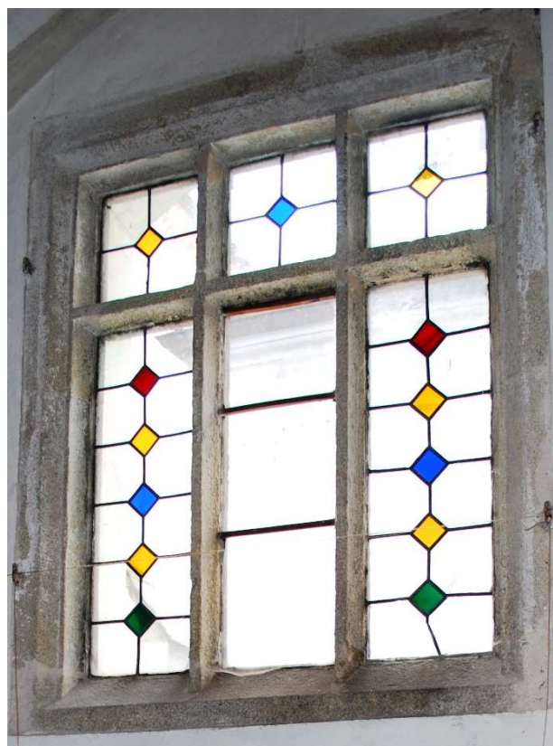
Pohled z ambitu 110127 hl 241