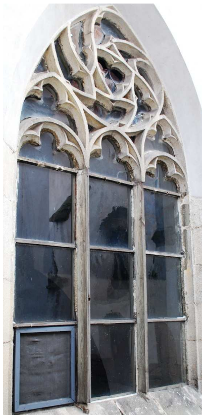
Pohled z rajskeho dvora 110210 hl 057