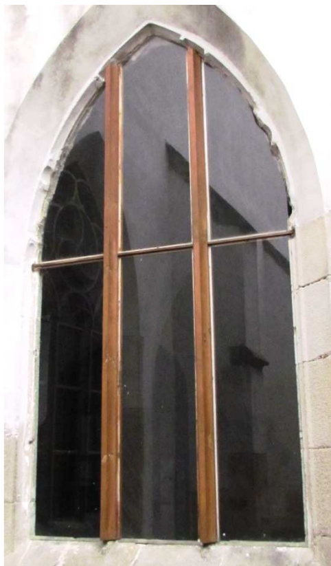
Pohled z rajskeho dvora 110310 hl 032