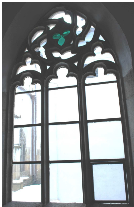
Pohled z ambitu 110127 hl 238