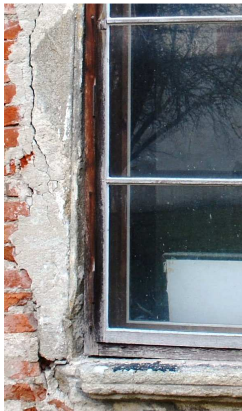
Detail stojky a parapetu 110210 hl 191