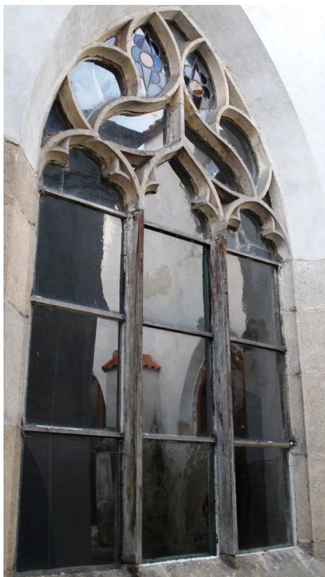
Pohled z rajskeho dvora 110210 hl 066

Poškozené, nevhodná náhrada kamenných prutů dřevěnými, poškozené zasklení.