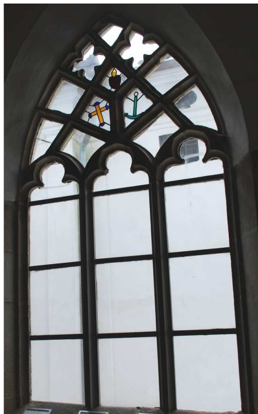
Pohled z ambitu 110127 hl 244