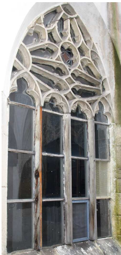
Pohled z rajského dvora 110210 hl 058

Poškozené, nevhodná náhrada kamenných prutů dřevěnými, poškozené zasklení.